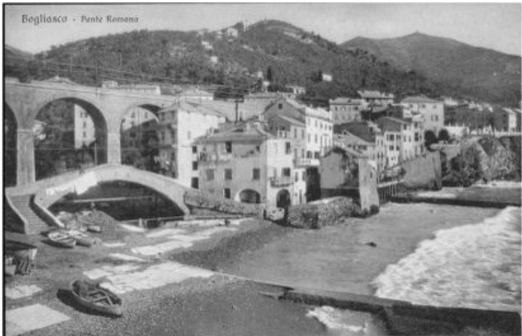
Bogliasco - Ponte Romano